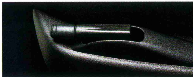
Höhenverstellung des Fahrersitzes