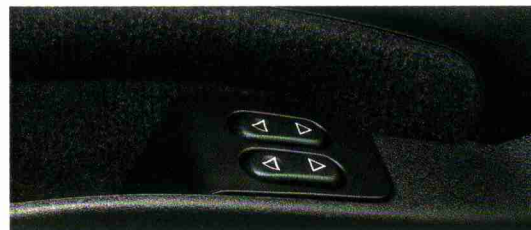
Elektrische Fensterheber vorn